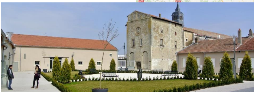
Espace Prieuré - Varangeville